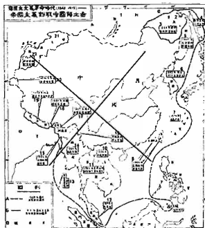
Bản đồ 1: Thời kỳ cách mạng dân chủ kiểu cũ (1840-1919) - Lãnh thổ Trung Quốc bị bọn đế quốc tước đoạt